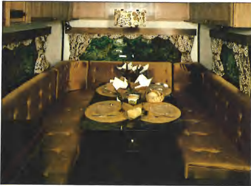
Interieur in echt walnoot hout. 110 ltr koelkast, aparte 'kinderkamer' met SMV's geniale bovenbed.

Het chassis van de SMV 590 is van aluminiumprofiel vervaardigd, sterkte-getest en onderhoudsvrij.