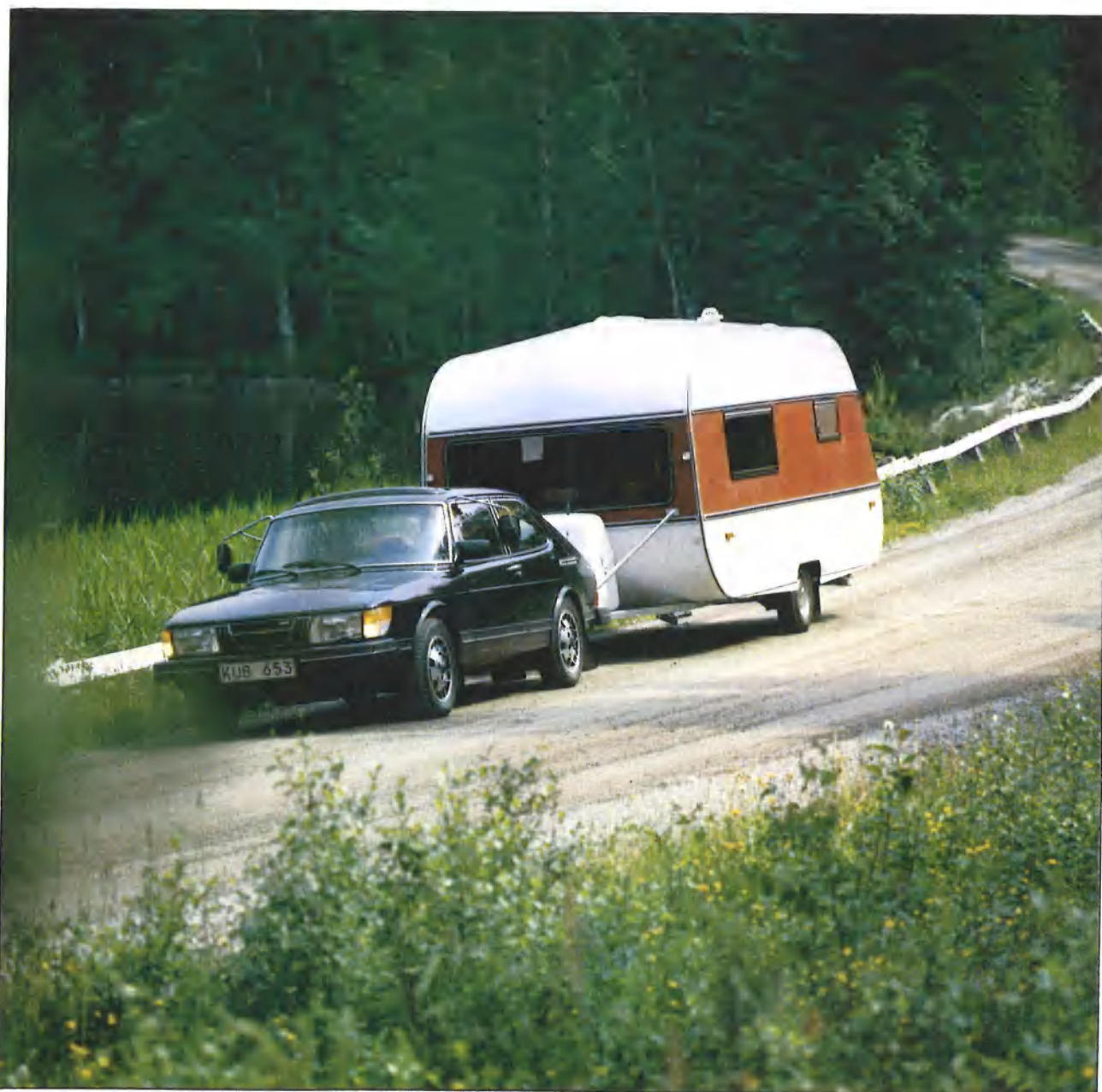
Het voortreffelijke rijcomfort van SMV is al jaren een begrip!

De kogeldruk, de belading en de bandenspanning moeten natuurlijk juist zijn, alsook de trekauto in goede konditie.