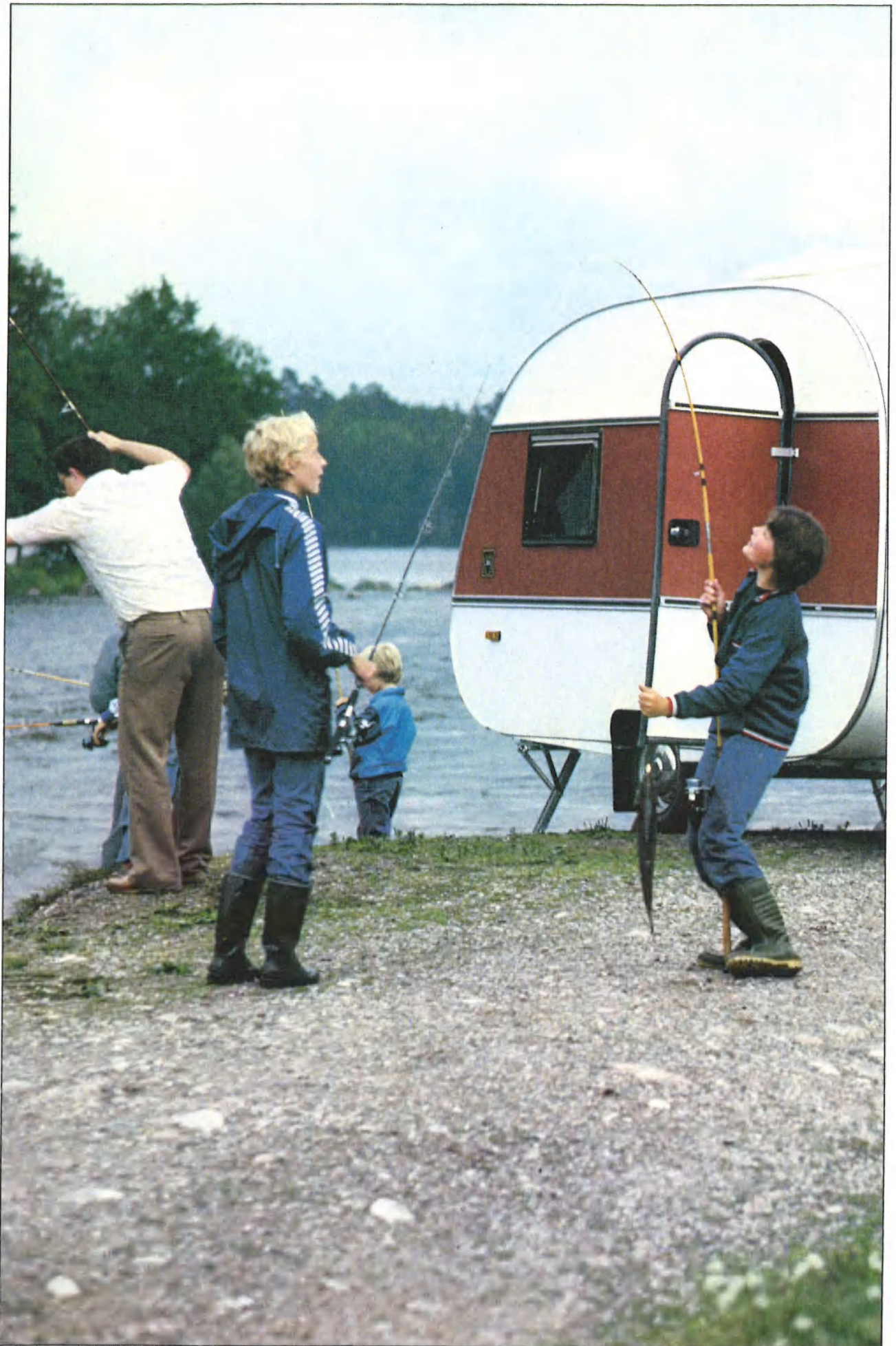
Met de SMV 380 komt u waar u wilt!