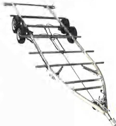
Het unieke lichte vierkant chassisprofiel is van aluminium bij de SMV 590.

De unieke kooi- en chassisconstructie geeft de SMV-caravans bovendien een laag gewicht. Een waardevolle eigenschap vooral bij lichte automobielen.