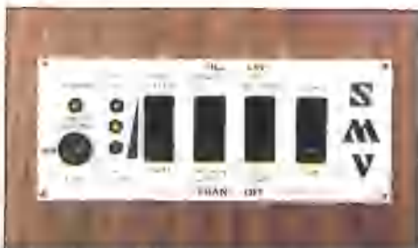
SMV's schakelunit helpt u opdat er ook zo elektronisch comfort is.

Er zijn mensen die dromen van een boerderijtje, maar boerderij betekent werk. Anderen weer van een tweede huis. Dat geeft echter geen echte vrijheid, waarbij men zelf zijn onbezette tijd kan bestemmen. Het is van veel belang tevoren na te gaan of het te investeren bedrag wel opweegt tegen het gebruik.