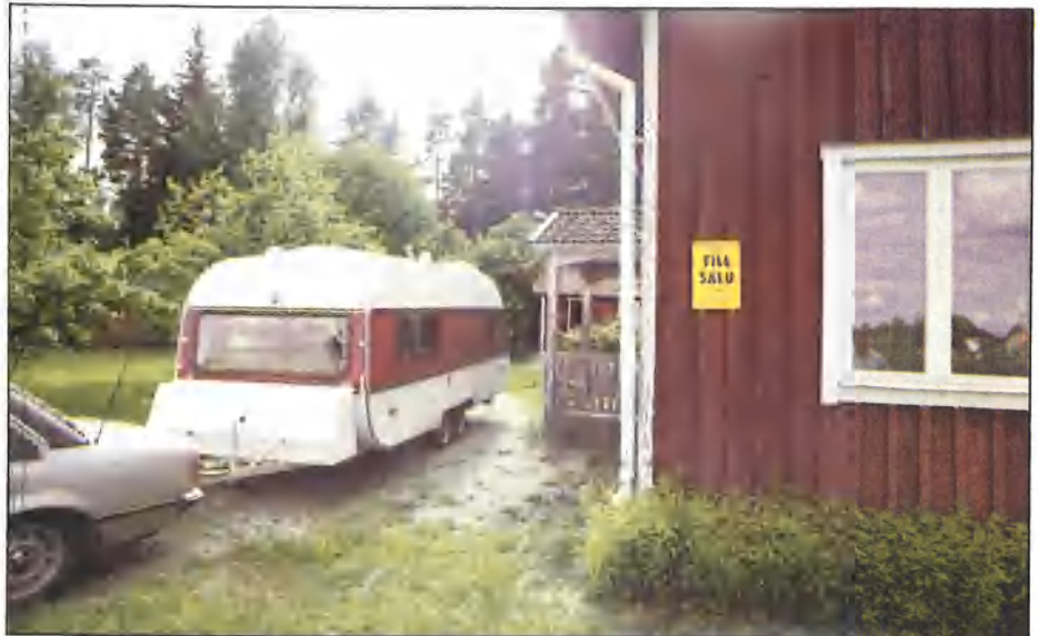
Boerderij geeft werk. SMV vrijheid!

Dat betekent verschillende dingen voor verschillende mensen. Eisen zijn immers zo afwijkend. De gemeenschappelijke noemers zijn vaak anders om het prettig te kunnen hebben als men woont in of rijdt met de caravan. Hier zijn dus 2 soorten comfort. Wooncomfort en rijcomfort. SMV heeft getracht te voldoen aan beide eisen: wooncomfort en rijcomfort boven het gewone!