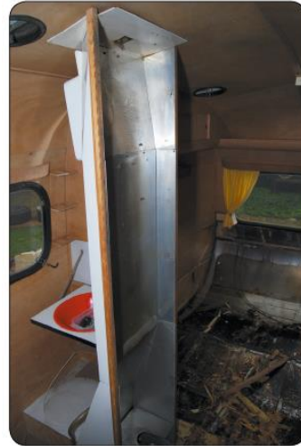
In feite fungeert het kachelhuis als deel van de badkamerwand