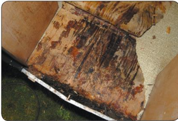
Op de meeste plekken was de bodem helemaal doorweekt

mee doen. Zoals ik bij voorbaat al verwachtte ging het inderdaad uitdraaien op de montage van een volledig nieuwe bodemplaat plus onderliggende latten, weliswaar met behoud van het oude isolatiemateriaal.