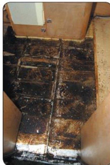
Met Kerst mocht de vloer opdrogen, geholpen door twee kacheltjes