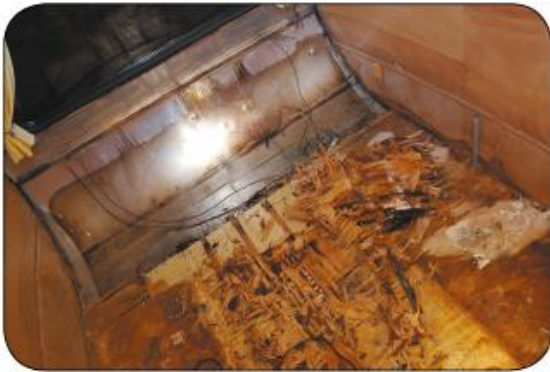
Het water loopt duidelijk naar het midden, waar de vloer het meest vergaan bleek

Kort voor Kerst stond ik op maandagochtend in de startblokken om de SMV naar Schoorl te gaan transporteren. Goede voorbereiding vormt het halve werk, dus als je dan op het laatst bedenkt niet over de juiste kentekenplaat te beschikken en na het wegrijden ontdekt dat de caravansleutel nog thuis ligt, dan zit je op hooguit een kwart. In de wintermaanden mogen we dankzij alle belastingperikelen met onze oldtimers de weg niet op, dus moest de Citroën ZX die als bedrijfswagen gebruikt maar als sleuder fungeren. Op onze 14LS past alleen een (bijna) vierkant nummerbord en dat zat niet bij de trektrusting van de auto. De tijd tikte door, dus zou ik de gok maar nemen? Nee! Ineens realiseerde ik me dat als de trajectcontrole of een andere camera onderweg het nog aanwezige kenteken van de klassieke Citroën CX zou registreren, ons ongetwijfeld een indrukwekkende naheffing van de fiscus wachtte. Wijselijk besloot ik een witte plaat met de correcte lettercombinatie te laten maken. Dat ik vijf minuten na vertrek rechtsomkeert moest maken om de caravansleutel op te pikken, viel in de categorie 'kleine ongemakjes'. Het werd al lastiger toen bij aankomst thuis bleek dat de deur op slot zat, met de sleutel aan de binnenkant erin, terwijl mijn partner boven stond te stofzuigen. Bellen, op het raam kloppen, met een lange tentstok boven tegen de rolluiken slaan, geen reactie. Na vijf minuten mopperen zag ik dan toch leven in de brouwerij.