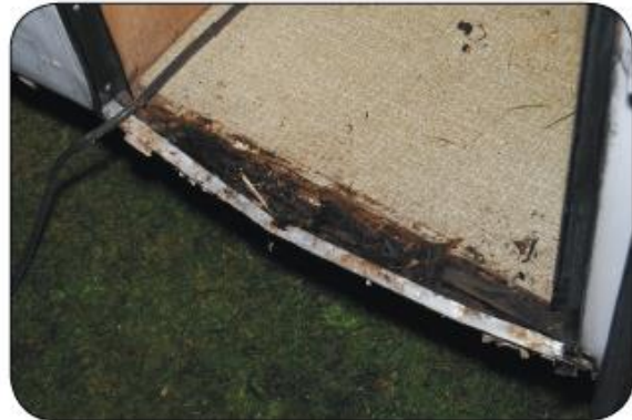
Bijna altijd prijs bij een SMV: een vermolmd instapdorpel