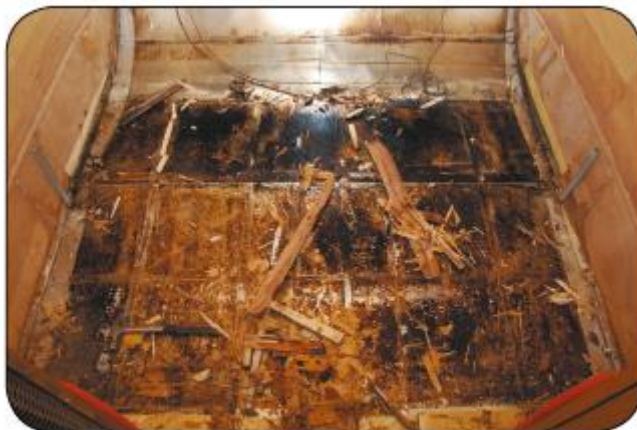
Zwarte aanslag op het aluminium door de combinatie van hout en vocht