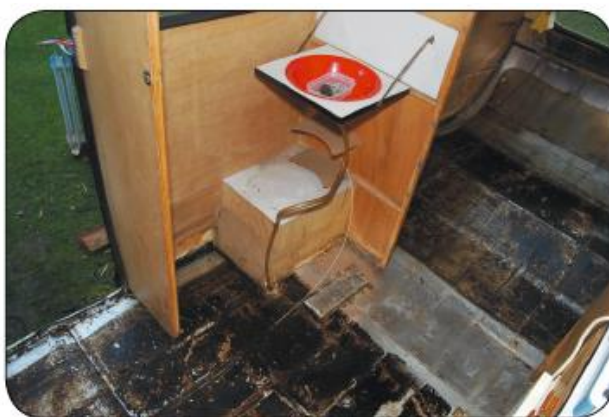
Met alles eruit kan de timmerman bij het vernieuwen van de vloer lekker doorwerken