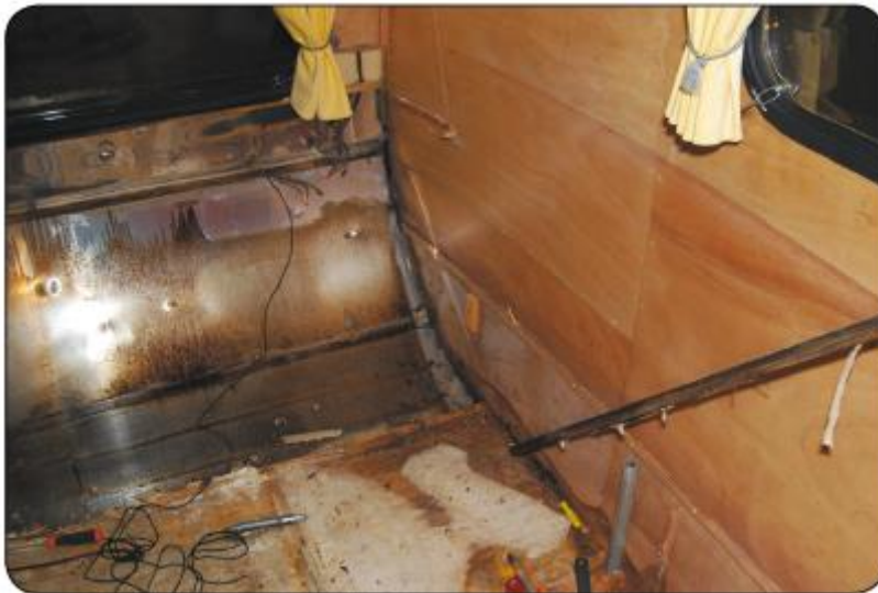
De eerste sporen van de vochtschade zichtbaar

Alle spookverhalen over houtrot drama's bij SMV's kenden we natuurlijk wel. Die zorgden ervoor dat we jarenlang struisvogelpolitiek bedreven. Onze 14LS gaf steeds meer signalen af van een dringende restauratiebehoefte, maar we verzonnen telkens een excuus waarom het even niet in de agenda paste. We zagen als een berg op tegen het ontmantelen van de caravan. Noem het gerust koudwatervrees, want onbekend met de materie durfden we er eenvoudigweg niet aan te beginnen. Twee dingen hielpen ons uiteindelijk over de drempel. Ten eerste was dat de voelbaar miserabele toestand van de vloer in combinatie met wel erg elastisch bevestigde trekstangen aan de buitenzijde. Ten tweede vertelde DSF-bestuurslid, een professionele timmerman te kennen, die zich wel aan een SMV durfde te wagen. Sterker nog, deze expert zou zich al op tweemaal een 12 gaan storten, namelijk die van hemzelf en die van een andere familie. Toen mijn vraag of ik waar mogelijk mocht meehelpen een positief antwoord opleverde, wisten we dat het juiste moment niet langer in de verre toekomst lag. Ik wilde graag zelf de handen uit de mouwen steken: in de eerste plaats voor de lol, in de tweede plaats om de caravan beter te leren kennen en in de derde plaats om de restauratiekosten een beetje in de hand te houden, want zo'n project valt altijd tegen.