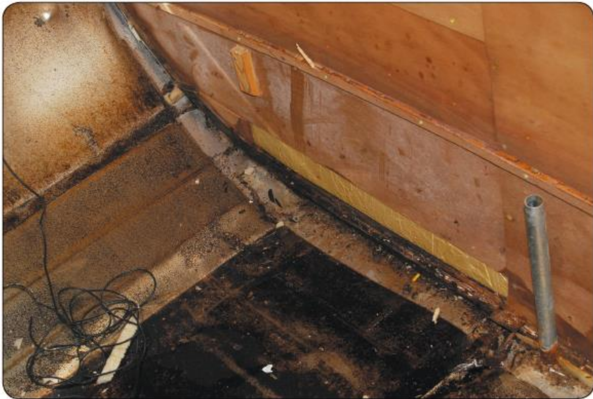
Onzichtbaar stukje van de zijwand links achterin weggesneden voor vervanging van de spant

Zo maakten we samen meters, heel voortvarend, terwijl de SMV het ons toch niet cadeau gaf. Het bleek af en toe flink martelen om bepaalde delen zonder schade te demonteren, want de mate waarin het fabriekspersoneel destijds de lijmpot hanteerde getuigt van fetisjisme. Op schroeven, spijkers en nietjes mocht je nooit zomaar blind vertrouwen, nee, je zekerde alles af met een laagje plak. Ik kon er niet eens gefrustreerd door raken. Een diep respect voor het kwaliteitsstreven van toen overvleugelde dat gevoel namelijk. Het maakte me alleen maar trotser zo'n topproduct te mogen bezitten. Terwijl ik voor in de caravan met een klauwhammer, een beitel, een legertje schroevendraaiers en een reuzehandige multitoel (een smal, haaks, elektrisch zaagje) in de weer was, klonk van achteren het geluid dat het met de spanten meeviel. Er moesten wel wat stukjes van vervangen worden, maar dat ging prima zonder de halve zijwanden te hoeven verwijderen.