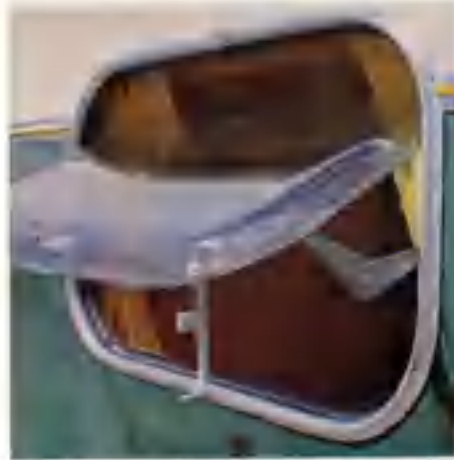
Öppningsbara fönster med dubbelglas — svalt om sommaren — varmt om vintern.