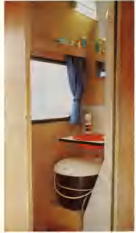
Toalettrum är naturligtvis standard i alla modeller.