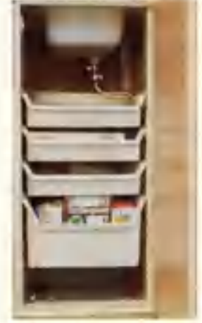
Rymliga plastbänkar i arbetsbanken.