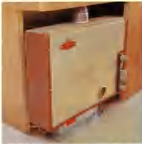
Radiatorvärme med termistat och cirkulationspump.