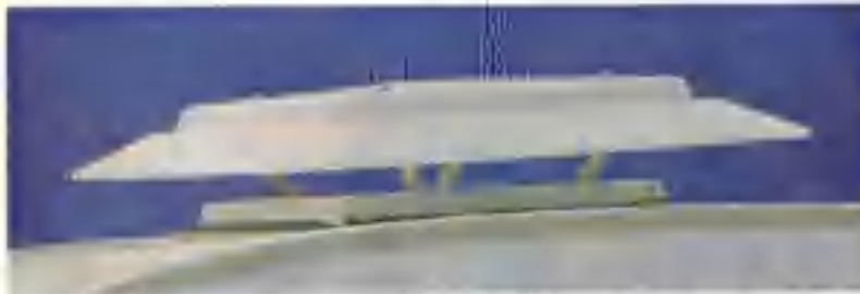
Takluckan med dubbelglas och droppkant släpper in både ljus och luft.