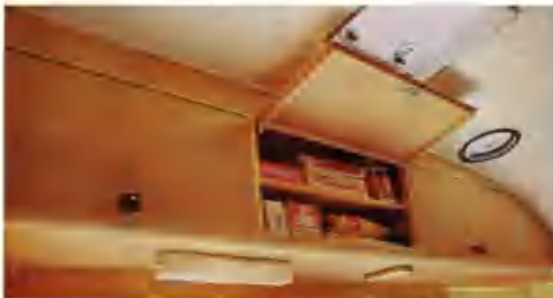
Stora välplanerade skåp utrymmen finns ovanför arbetsbanken.