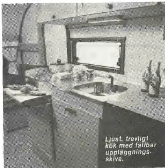
Ljust, trevligt kök med fällbar uppläggnings- skiva.

Polyurethanisolerat golv 30 mm Väggisolering 30 mm Polyurethan Chassi helgalvat Radialdäck Stödhjul Stödben 4 st inkl. vev En axel m. bladfjädrar Elektronisk broms Ventilerande taklucka Dubbfönster Rullgardiner Gasoläckagetestare Elektrisk vattenpump Centralavlopp Centralvärme