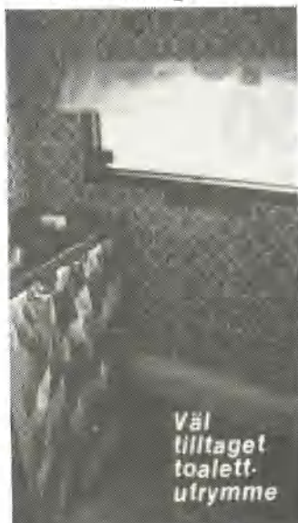
Väl tilltaget toalett- utrymme

Polyurethanisolerat golv 30 mm Väggisolering 30 mm Polyurethan Chassi helgalvat Radialdäck Stödhjul Stödben 4 st inkl. vev En axel m. bladfjädrar Elektronisk broms Ventilerande taklucka Dubbfönster Rullgardiner Gasoläckagetestare Elektrisk vattenpump Centralavlopp Centralvärme